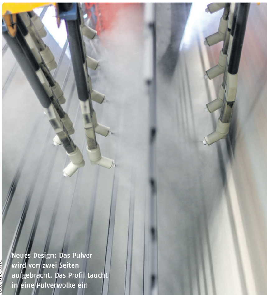
Neues Design: Das Pulver wird von zwei Seiten aufgebracht. Das Profil taucht in eine Pulverwolke ein

Schließlich hat SAT eine relevante Innovation in Bezug auf die Prozesssteuerungs- und Überwachungssoftware entwickelt. Da die zunehmend geforderte Wiederholbarkeit der Beschichtungsergebnisse nur durch eine höhere Automatisierung des